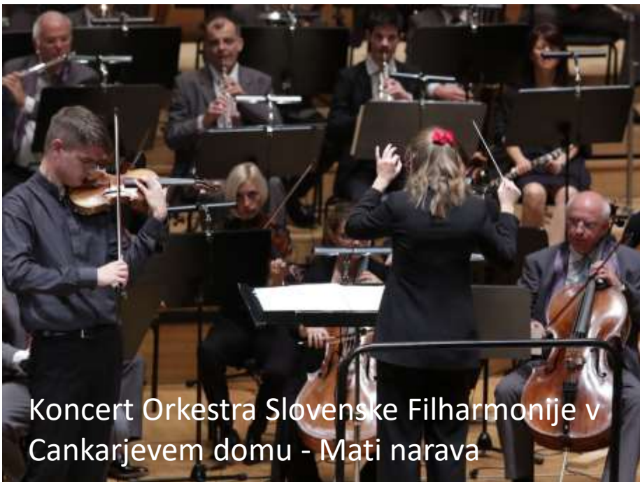
Koncert Orkestra Slovenske Filharmonije v Cankarjevem domu - Mati narava