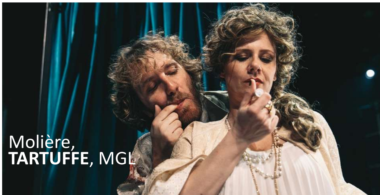
Molière, TARTUFFE, MGL